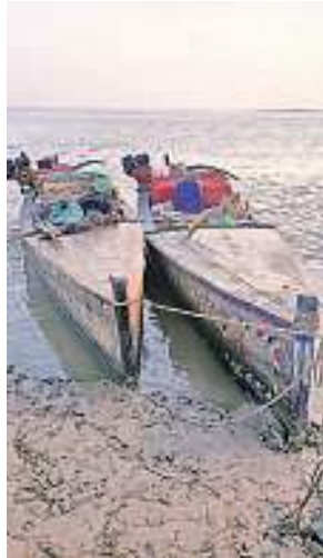
Two Pakistani fishing boats seized by the BSF.

Nothing suspicious was recovered on searching the boats, the release added.