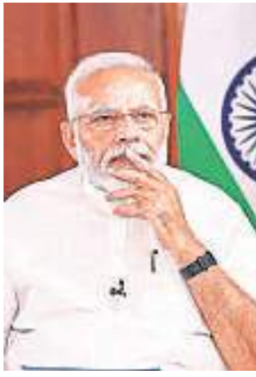
Prime Minister Narendra Modi during the inauguration of various projects in Valsad through video-conferencing.

The PM highlighted that in addition to the Covid vaccine campaign, India was also carrying out a nation-wide vaccination for animals, including cows and buffaloes, against the